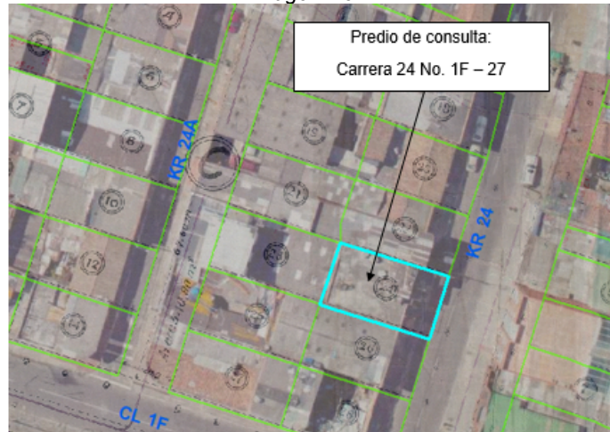
Imagen parcial Plano 106/4-1 y Cobertura "Lote" de la BDGC de la SDP y Orthofoto Bogotá 2014

La Estación de Clasificación y Aprovechamiento – ECA, objeto de consulta se encuentra localizada en el “Área de Actividad de Proximidad - AAP- Generadora de soportes urbanos”, dentro de la Unidad de Planeamiento Local - UPL No. 23 Centro Histórico, de conformidad con lo establecido en el plano CU – 5.2 Áreas de Actividad” del Decreto Distrital 555 de 2021, como puede verse en la imagen No. 2.