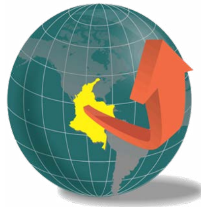
Logo por: Contaduría General de la Nación

Para realizar el reconocimiento contable de los actos jurídicos celebrados por las entidades sujetas al ámbito de aplicación del Marco Normativo para Entidades de Gobierno, sean convenios o contratos administrativos o interadministrativos, se deben tener en cuenta aspectos como: