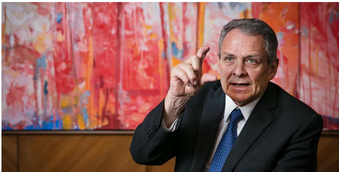
Juan José Echavarría, gerente del Banco de la República, hace un análisis de la economía del país hacia el futuro.

“Este segundo trimestre será el peor del año y tal vez de la historia”: Banco de la República