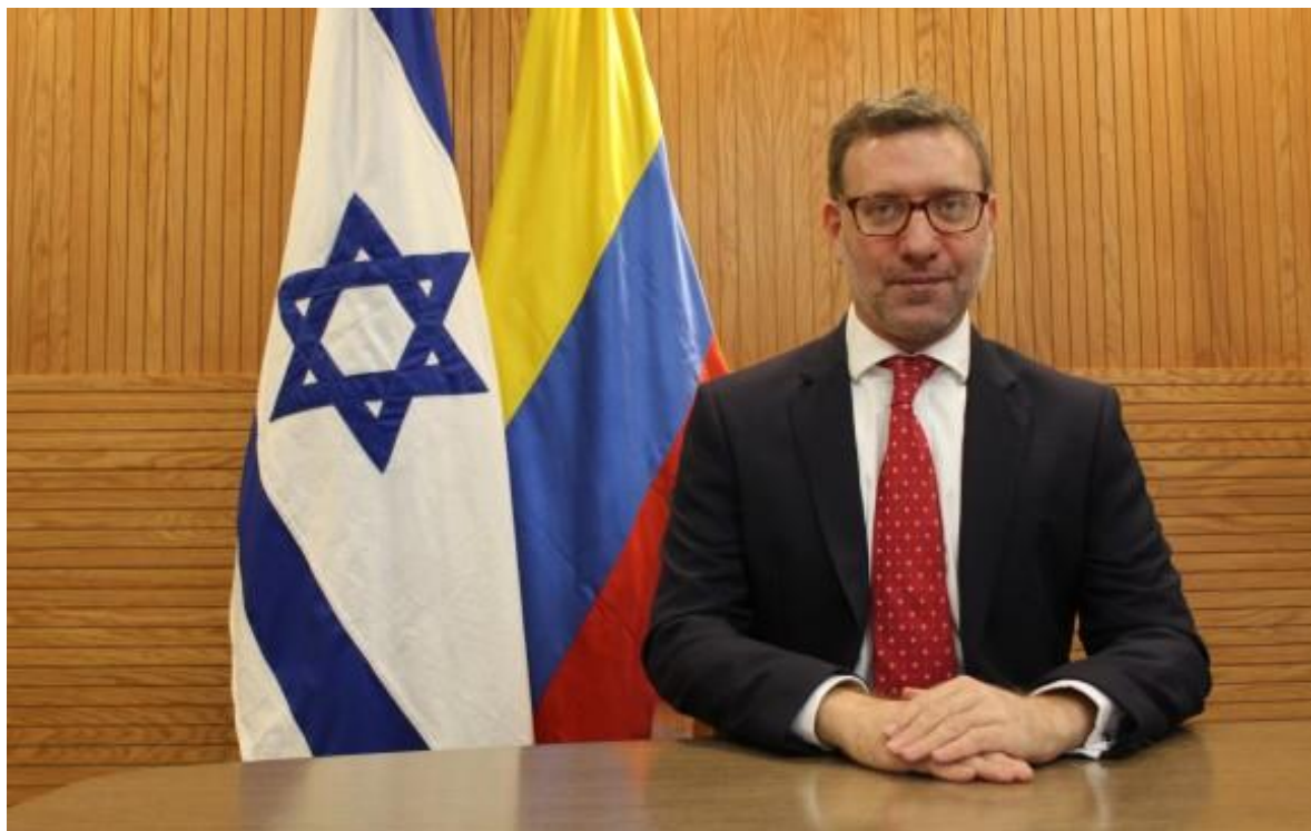
Christian Cantor, embajador de Israel en Colombia, asegura que en adelante habrá diversos eventos para que empresarios de ambos países conozcan oportunidades bilaterales.

“No solo exaltamos el hecho del TLC, sino el potencial de crecimiento que tiene Colombia, que es un centro de aprendizaje e innovación. Hay oportunidad de cooperación entre las dos economías para aumentar las exportaciones mutuas.”