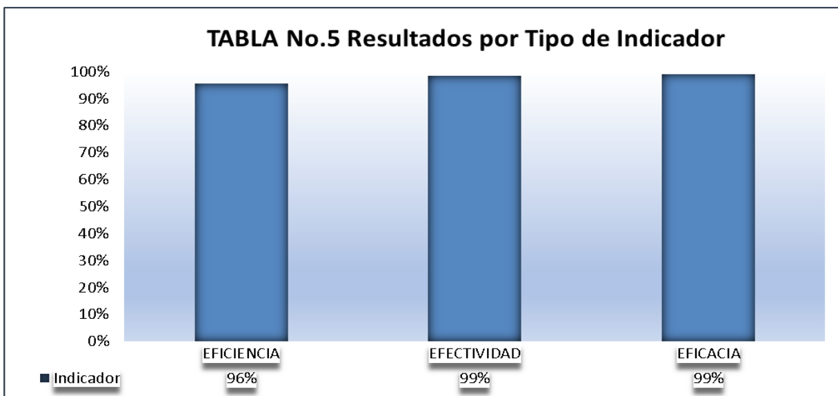
Tabla 5. Resultados por Tipo de Indicador y de Procesos